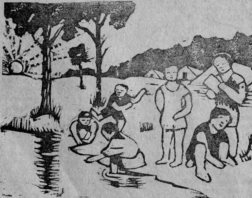
Солнце, воздух и вода—друзья пионеров.]